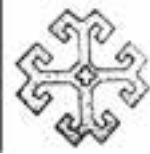
شکل ۵- طرح نهایی شماره (۱)