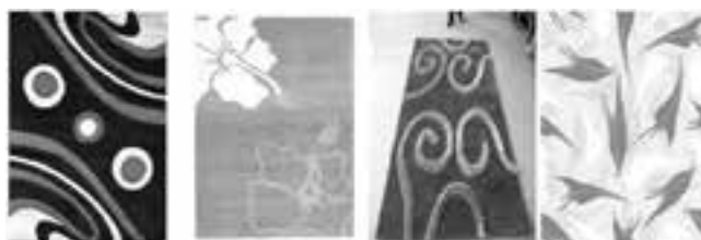
شکل ۲- نمونه فرشهای مدرن خارجی موجود در بازار