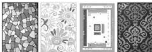
شکل ۱- نمونه فرشهای مدرن ایرانی موجود در بازار

در ادامه نمونه‌هایی از این فرش‌ها را می بینیم مرحله اول: بررسی نمونه فرشهای موجود در بازار